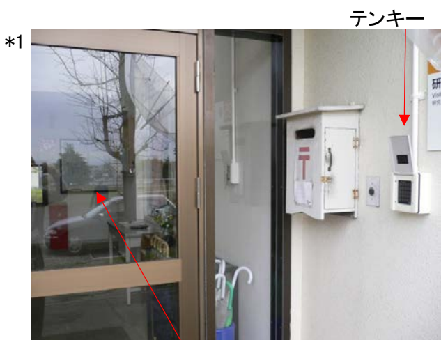
入ると正面に掲示板↓